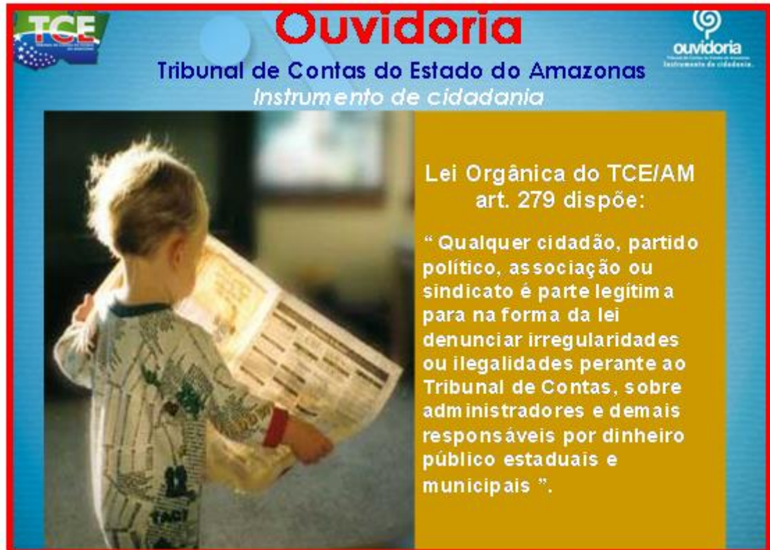
Figura 1. Lei Orgânica do TCE-AM.